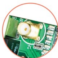
Złącze antenowe SMA