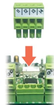
Rozłączne listwy zaciskowe