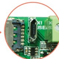
Do programowania port USB micro B