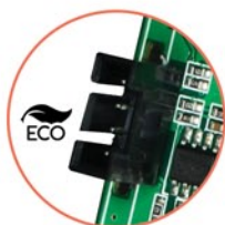
Współpraca z dedykowanym zasilaczem PSR-ECO 2012