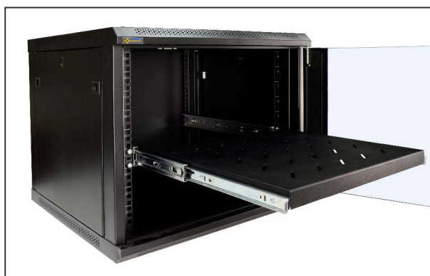
pełny wysuw półki