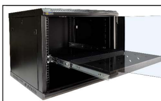
pełny wysuw półki