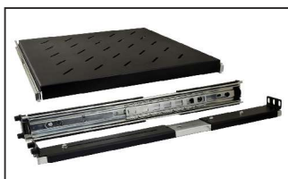
półka z prowadnicami