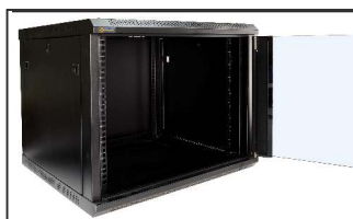
pusta szafa RACK 19"