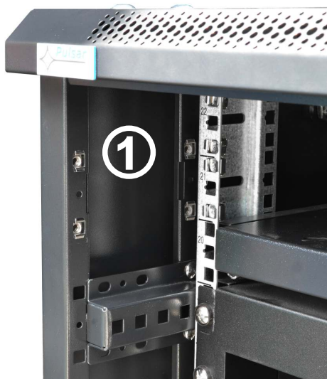
Montaż: lewa strona szafy.