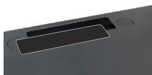
wybity przepust kablowy