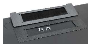
przepust szczotkowy RAPS-A