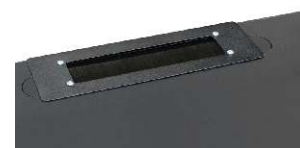
zamontowany przepust szczotkowy RAPS-A